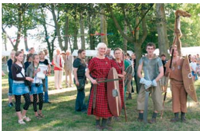
Celtowie zawitali do Jabłkowa.