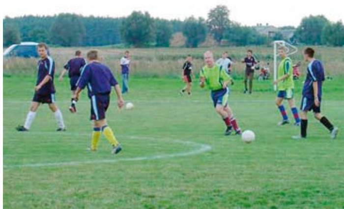
Turniej wiejskiej ligi piłki nożnej.