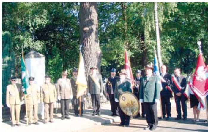
Wizyta Braci Kurkowych na skockim cmentarzu.