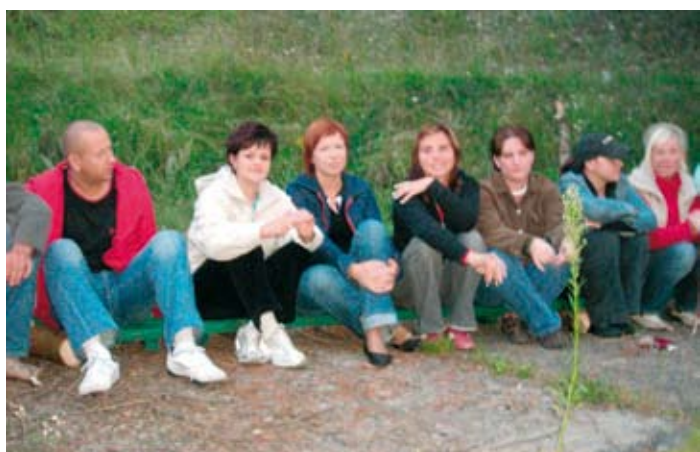
Spotkanie skockich harcerzy.