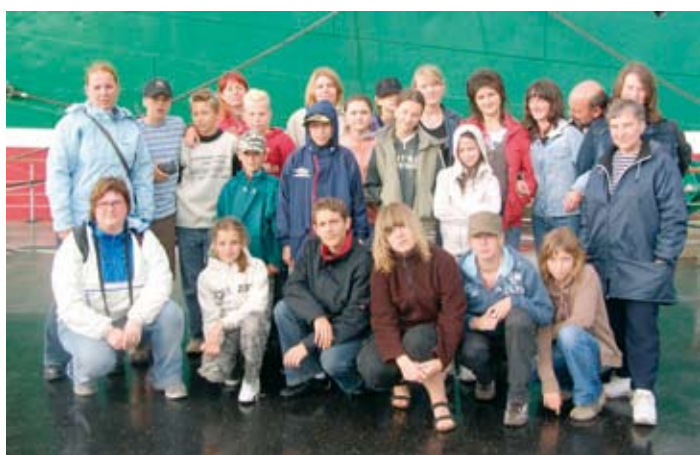
Obóz młodzieżowy w Bardowick.